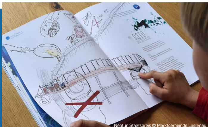
Neptun Staatspreis

Das „WER WIE WASSER – Mitmachbuch“ ist ein gemeinsames Projekt von Lustenauer Kindern und Erwachsenen. Im Zuge von abwechslungsreichen Workshops verfolgten Expertinnen und Experten für Wasser sowie Pädagogik, Grafik und Text gemeinsam mit 70 Kindern die Reise des Lustenauer Wassers. Herausgekommen ist dabei ein spannendes 80-seitiges „Kritzelnbuch“.