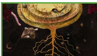
DIE RÜBE (Estland 202...

Das Team des EU Youth Cinema: Green Deal