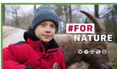
FÜR DIE NATUR (UK 2...