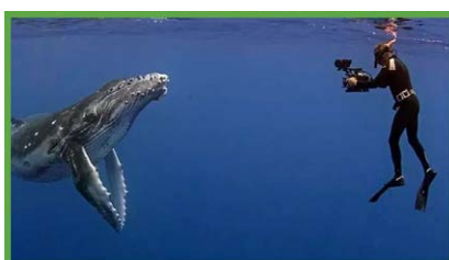
VIELEN DANK, MEER (...