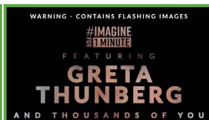
STELL DIR EINE MINU...