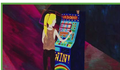
SOZIALER KÄFIG (Tsc...